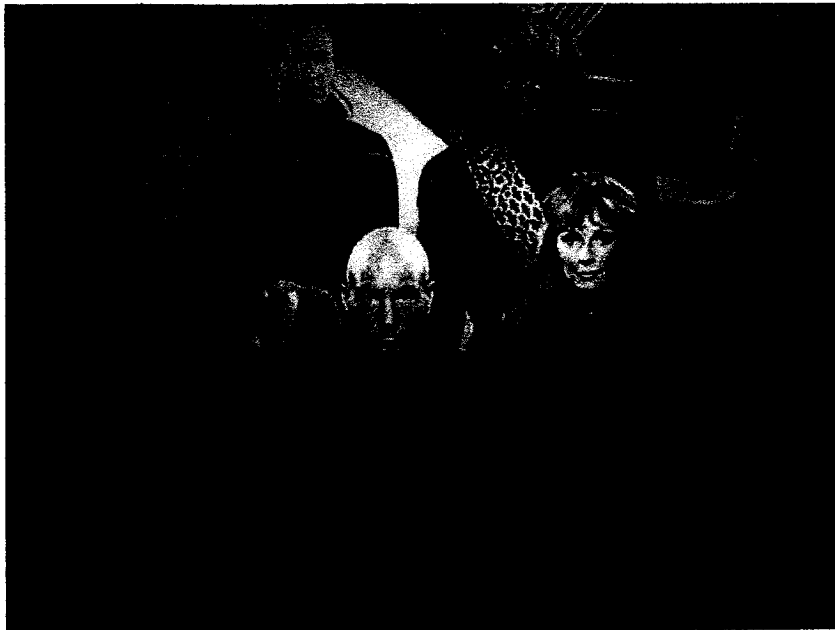
Affiche "Star Trek" de la Commission Européenne « Europe 2020 »

L'autre originalité du droit communautaire, par rapport au droit international, est qu'il peut s'imposer directement aux citoyens européens, sans qu'il soit nécessaire pour les Etats membres de le retranscrire par des actes juridiques nationaux. On parle d'"effet direct" du droit communautaire.